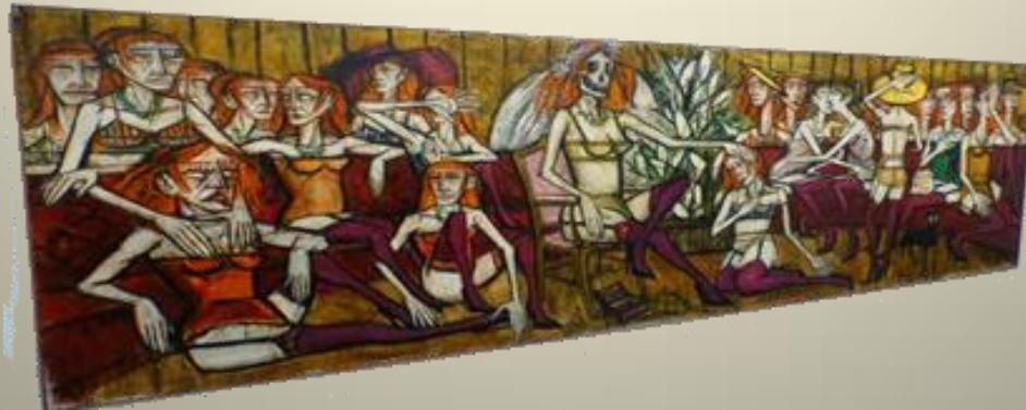
Les Folles, La Mariée, 1970