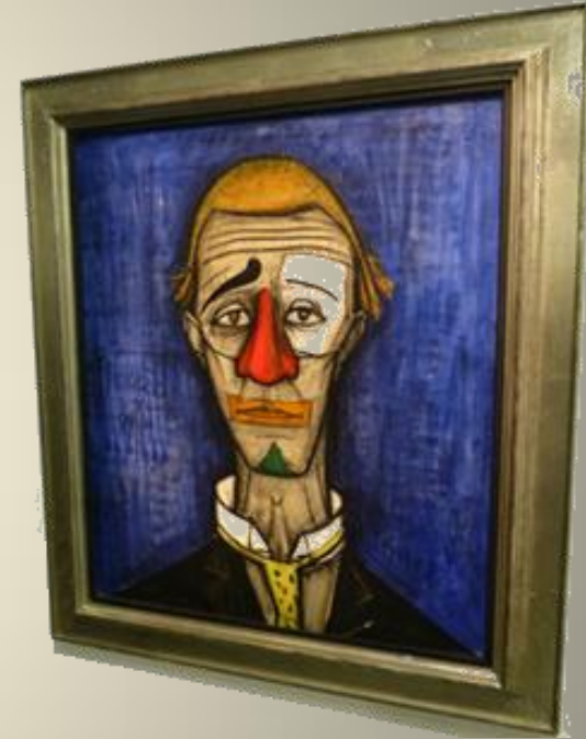
Tête de clown, 1955

La rétrospective est généreuse : une centaine de peintures dont de très grands formats, mettent en perspective ses principaux thèmes de prédilection : clowns, cycles religieux, mythologiques, littéraires ou allégoriques, horreur de la guerre, proximité de la mort.