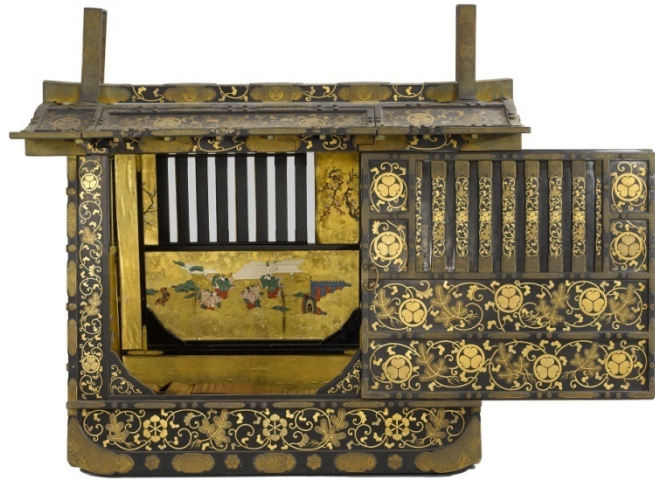
Palanquin époque d'Edo, XIX e siècle

L'exposition s'ouvre sur « les acteurs de la découverte » de l'art japonais et le rôle des Expositions universelles dans la transmission de cette culture à partir de 1867, date à laquelle le Japon y participe pour une première fois.