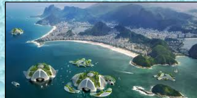
Projet pour Rio de V. Caillebaut

TARIF: 10€ (adhérent) 16€ (non adhérent)