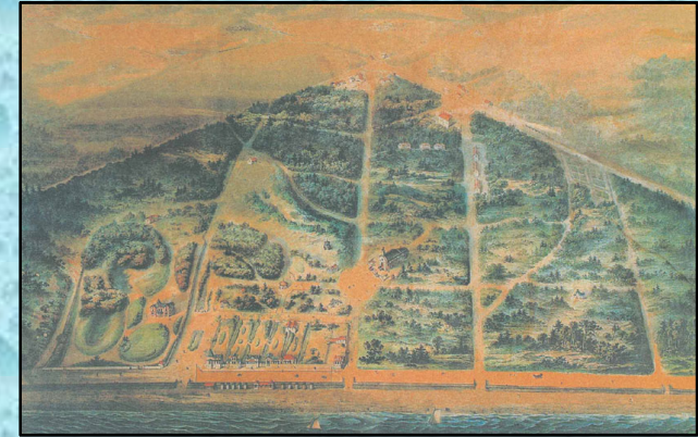
Plan de La Baule 1878