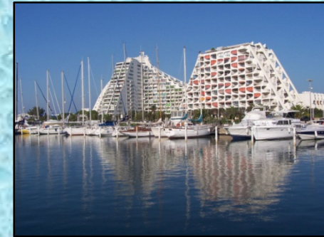
La Grande Motte

Elle retrace également l'évolution de la société et de son rapport au littoral à travers des objets cultes. Le bord de mer d'abord lieu hostile voire dangereux, puis villégiature avant d'être la destination privilégiée d'un tourisme de masse.