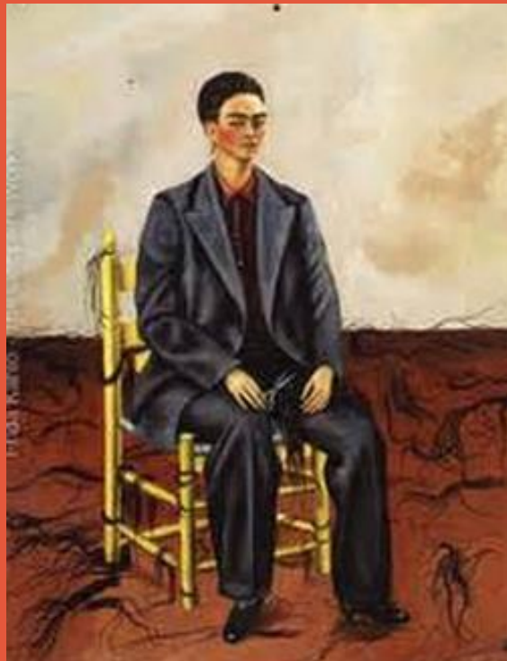
Frida Kahlo - autoportrait 1940

Le parcours dresse un constat de la bouillonnante créativité artistique du pays tout au long du XXe siècle.