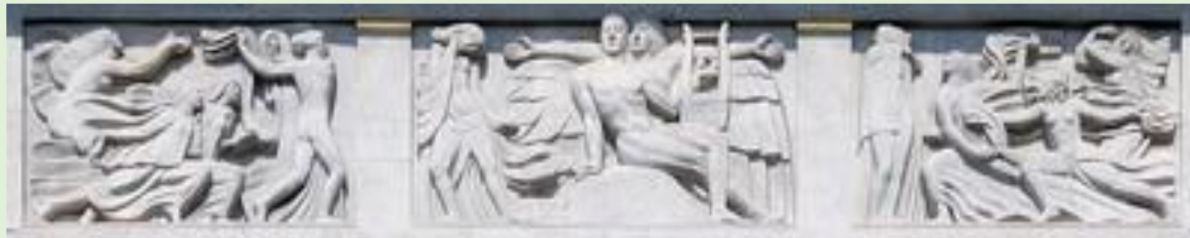
Bas-relief de la façade par Antoine Bourdelle