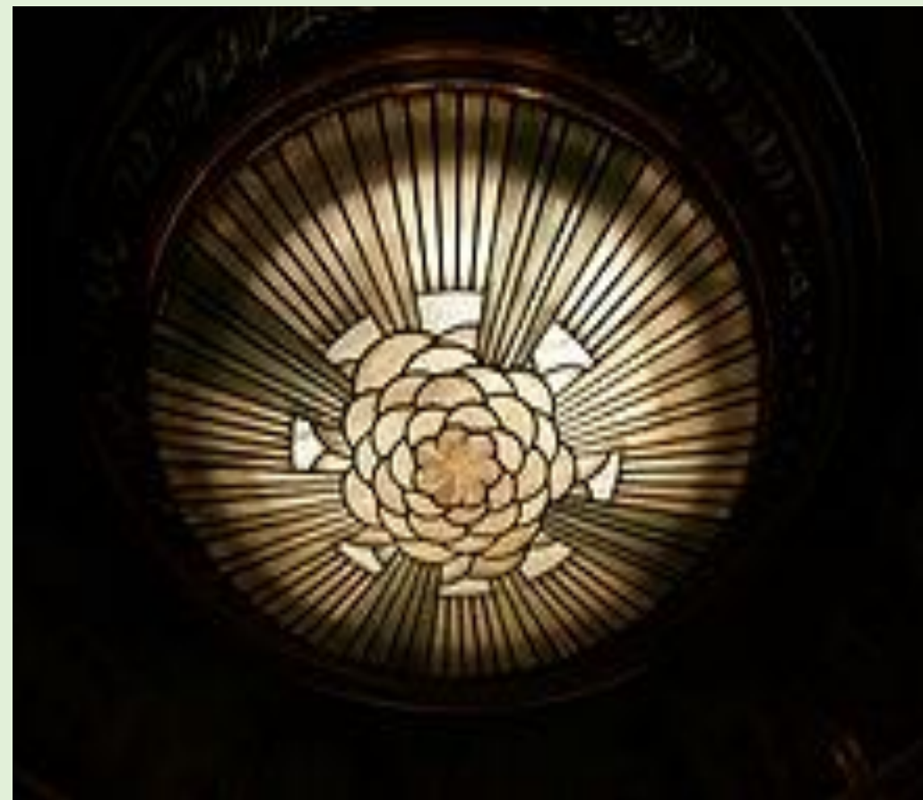
Plafond art déco de la grande salle